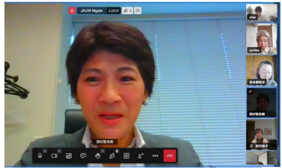
10/1 学習会 国の政策、最新の動きについて