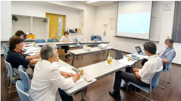
7/30 学習会「気候変動とコメ」 専門家を招いて

セミナーの大テーマである「くらしの視点から」にふさわしい、生活者の多様な意見を集めることができました。