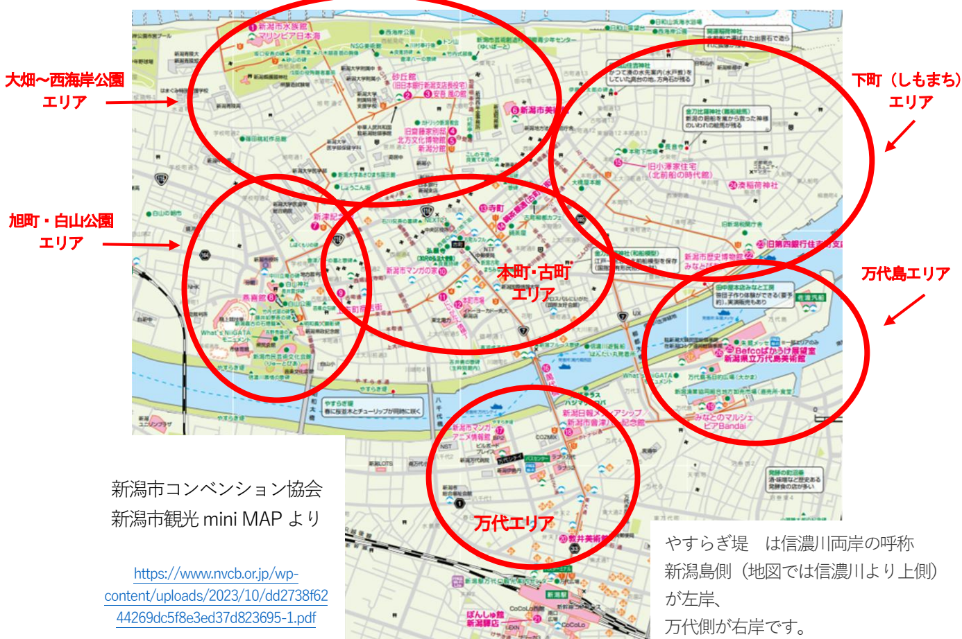
新潟市コンベンション協会 新潟市観光 mini MAP より

https://www.nvcb.or.jp/wp-content/uploads/2023/10/dd2738f6244269dc5f8e3ed37d823695-1.pdf