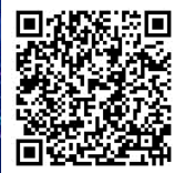
Global Gender Gap Report 2023