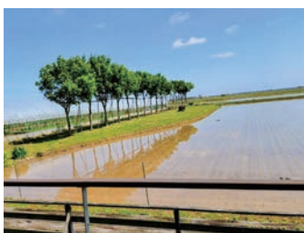
トネリコが映る水田の風景

最終日19日は研修旅行、40名の参加。初めに農業・食文化の継承と新しい価値づくりに取り組んでいる「そら野テラス」を訪問、越後姫という名の幻の苺をいただく。このテラスからの眺めは今が一番美しいと聞き及び、写真に納める。次は三条市立大学へ。2021年4月に開学した工学系単科大学で、燕三条の多くの物づくり企業が学生の学びを支えている。初代学長、バンガラデッシュ生まれのアハメド・シャハリアル氏が流暢な日本語でご説明くださる。実学志向の学びに徹し、この3月第1回卒業生を企業に送り出したとのこと。次に2000年にわたり伝統技術を継承している、無形文化財鋳造銅器玉川堂（ぎょくせんどう）を訪れて旅の締め括りとなった。