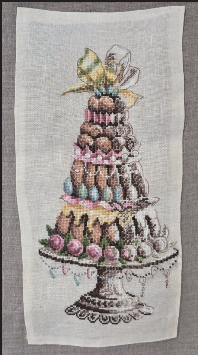
テーブルセンター お菓子のツリー

クロスは布の目を数えて刺します。細かい目の布を使うと緻密で立体的な作品ができるので、細かい目の布を選択しています。ハードですが完成した時の喜びは何ものにも代えがたいものです。