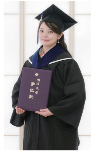
明治大学大学院 国際日本学研究科卒業(2025年3月)