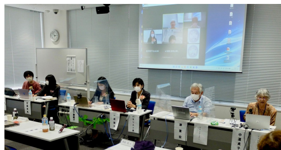
公開シンポジウムのようす

10月22日(土) 公開シンポジウム「教育・ジェンダー・共生 ～ユースの視点から見直そうこれからの日本～」 奈良支部長が対面参加、奈良支部会員オンライン参加5名 奈良関係者 4名参加