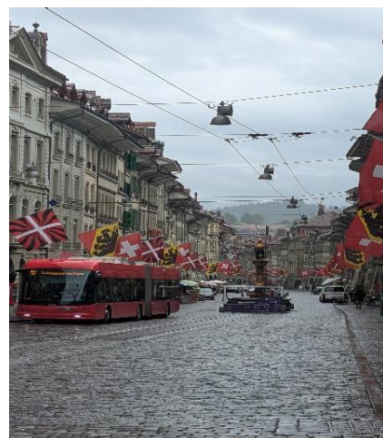
(世界遺産のベルン市街)