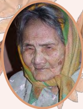
ベトナム英雄の母