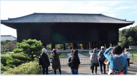
「東大寺校倉の謎と魅力」に参加して（報告）