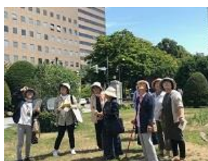
「ガイドと歩く大通公園」