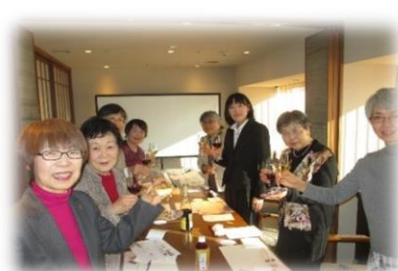
＜新年会 及び 奨学金贈呈式＞